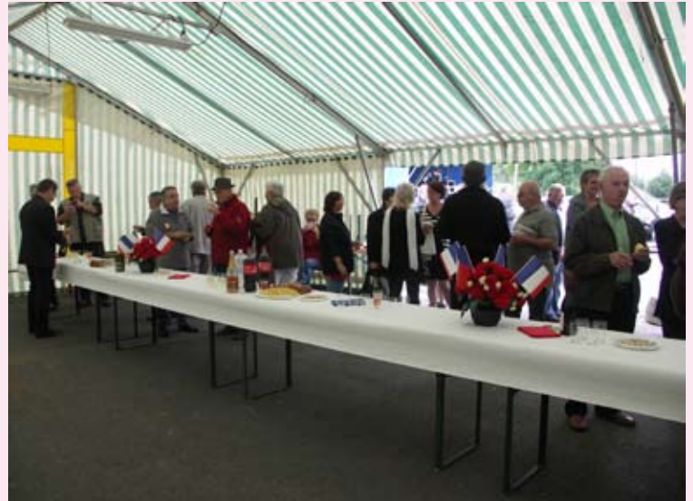
Le vin d'honneur sous châpiteau a été apprécié.