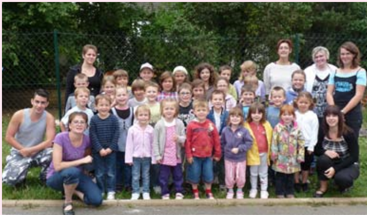
Le centre de loisirs a fonctionné durant 3 semaines en juillet, en proposant toute une gamme de jeux, d'activités sportives et culturelles. 7 animateurs ont encadré 35 participants.