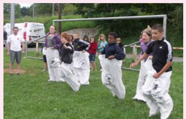
Des animations pour tous les âges.