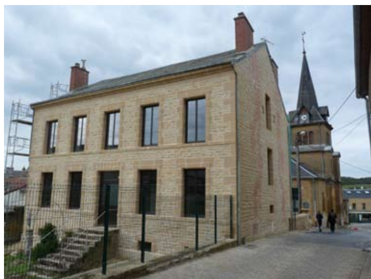
Le presbytère restauré, va ouvrir sur 1 salle et 2 appartements.