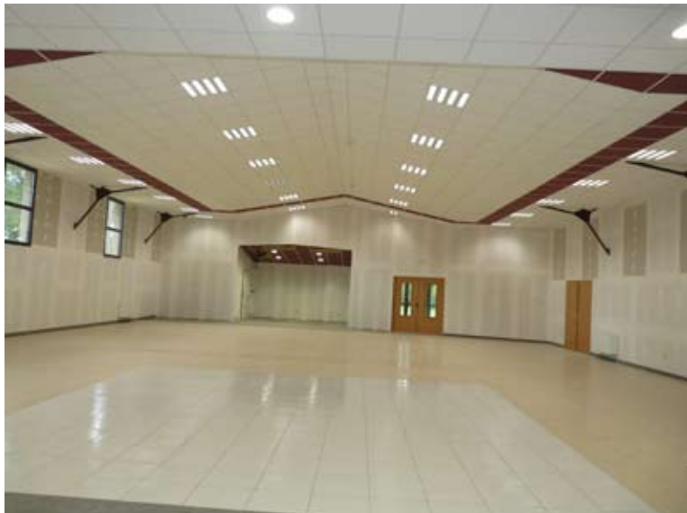
Encore quelques semaines avant la réouverture définitive de la salle polyvalente