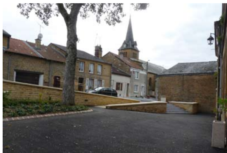
Prochainement, la pose d'une grille de protection et d'une lisse d'accès termineront l'entrée aux services de la Mairie de la rue des Sauvages.