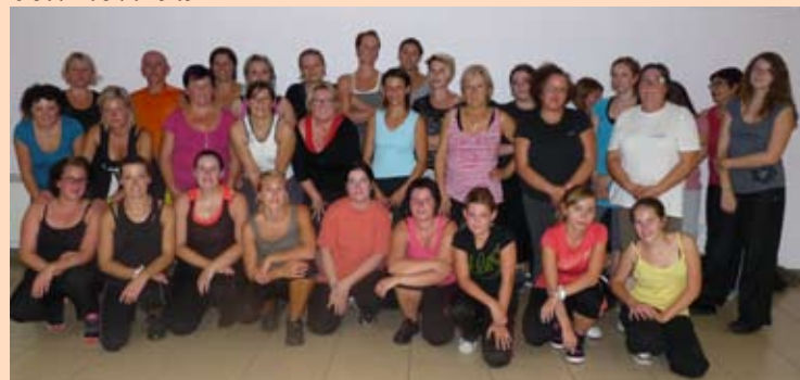
L'équipe du lundi

Renseignements auprès du 03.10.07.64.84 et/ou 06.74.67.29.91