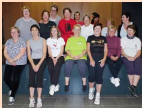
L'équipe du jeudi

Photo d'archives, en attente d'une plus récente de la saison 2013-2014 qui sera publiée dans le prochain bulletin.