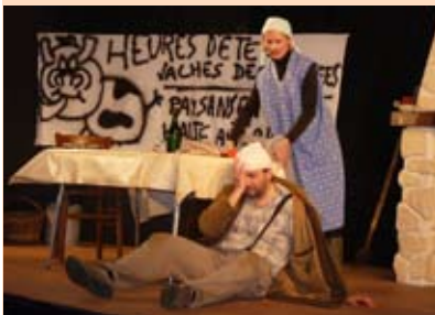
«Avocat sauce agraire» par les Utopistes