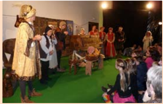
«Les 4 filles Aymon» par le cercle Pierre Bayle de Sedan

Sur une durée de 4 jours, le festival de théâtre organisé par les Utopistes et l'association le Lac, a connu un vif succès. Plus de 1000 personnes ont assisté à une douzaine de représentations interprétées par différentes troupes de théâtre amateur des Ardennes, dans la salle polyvalente et le pôle scolaire.