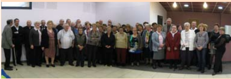
Comme chaque année, le club de nos aînés s'est retrouvé pour savourer un bon repas.