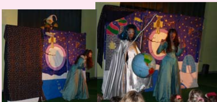
Précédent le père Noël, le spectacle «Floconia» interprété par la Cie Le temps des rêves.