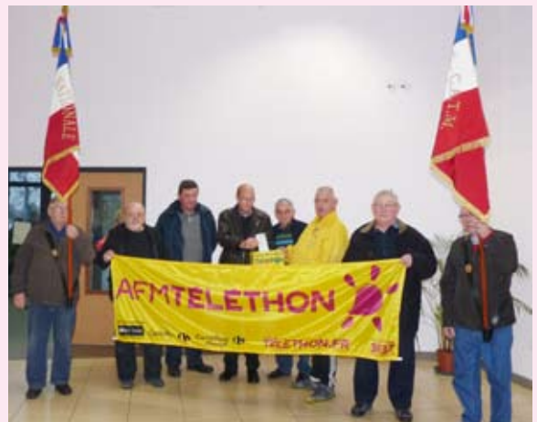
L'association des Anciens combattants et soldats de France.