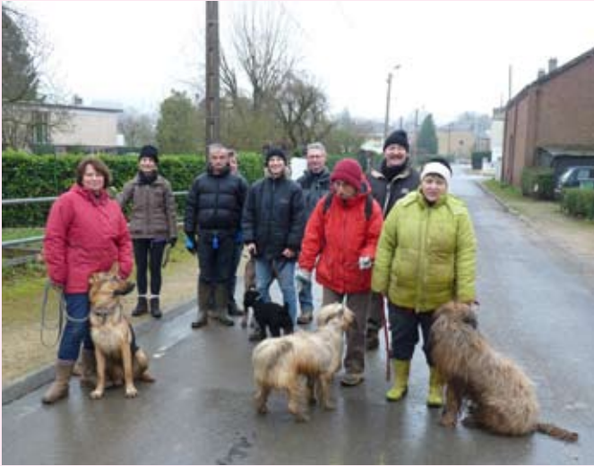
L'amicale Canine a aussi participé à ce élan du coeur.