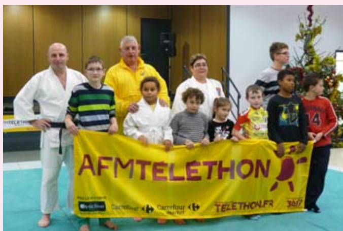
Le Jujitsu club de Boulzicourt a initié les jeunes.

Pour fêter son anniversaire, des voisins, des personnes quotidiennement dévouées auprès d'elle, ainsi que des membres de la municipalité étaient venus l'entourer.