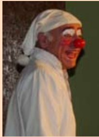
«Mais qu'est ce que vous faites chez moi ?» par la Cie des Nez en Bulles