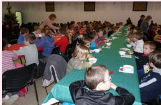
L'après-midi récréatif avec ses magiciens et clowns de la troupe Eric Production, s'est terminé par un goûter et l'arrivée du père Noël