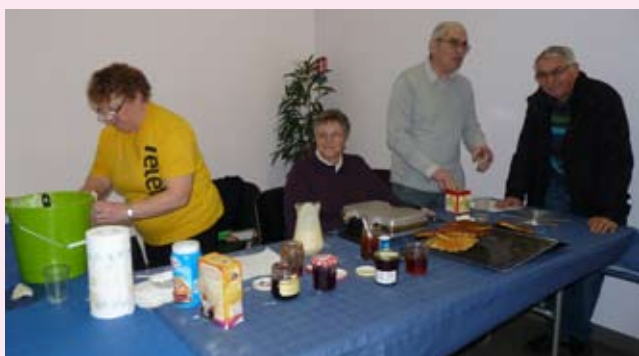
Les gaufres préparées avec passion par l'association «Familles rurales Seniors»