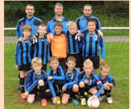
L'école de foot à l'entraînement

Sur une durée de 4 jours, le festival de théâtre organisé par les Utopistes et l'association le Lac, a connu un vif succès. Plus de 1000 personnes ont assisté à une douzaine de représentations interprétées par différentes troupes de théâtre amateur des Ardennes, dans la salle polyvalente et le pôle scolaire.