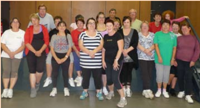
Photo manquante du bulletin précédent du cours de gym du jeudi de l'association GEAB .