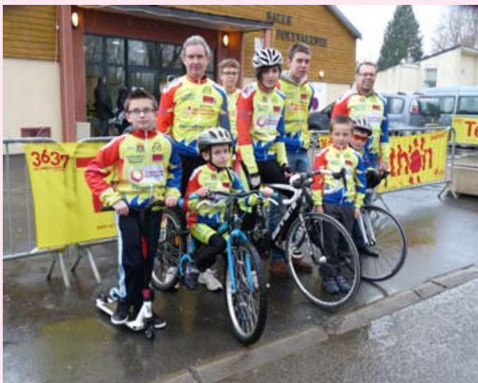
Le club cyclistes des cadets de l'ECVB, avec leur encadrement toujours dévoué.