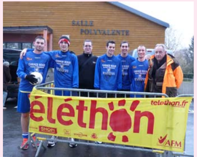
Un échantillon de colosses de l'équipe de foot de Boulzicourt.