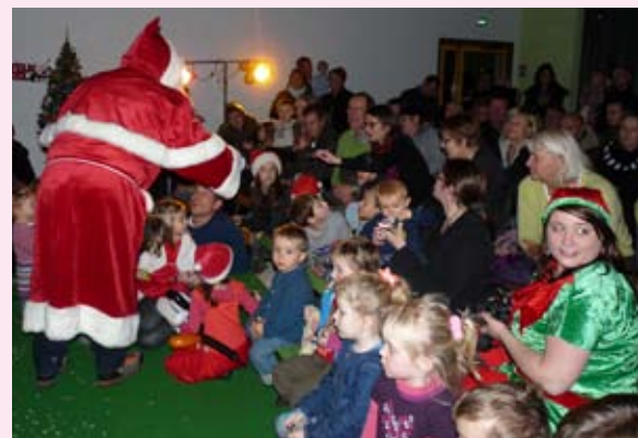
L'arbre de Noël a eu lieu aussi pour les petits Nutons des Crêtes.