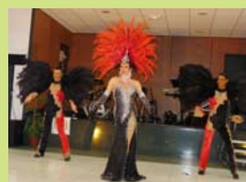
Pour cette fin d'année, le Comité Communal d'action sociale offrait une journée récréative aux seniors.