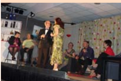
«L'anniversaire ou la Renaissance» par les 2 Masques.