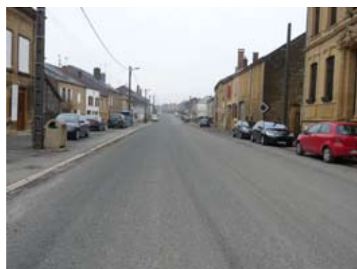
Financée par le Conseil Général, la réfection par un gravillonnage a amélioré sensiblement notre traversée de village. Espérons que l'hiver ne détériore pas de nouveau ce revêtement.

Le Conseil Municipal soutient toujours les activités de nos associations, ainsi nous sommes toujours prêts à les aider dans la limite de nos possibilités. Pour mieux connaître vos besoins, nous demandons à tous les présidents d'associations de renouveler la demande de subventions municipales pour l'année 2014, avant le 15 février dernier délai, accompagnée d'un rapport d'activités et de finances de l'année précédente, ainsi qu'une présentation des nouveaux projets pour 2014.