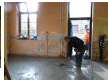
Commencée en septembre

La salle de réunions située au rez-de-chaussée de la mairie vient d'être achevée juste à temps pour fêter le Noël des employés communaux.