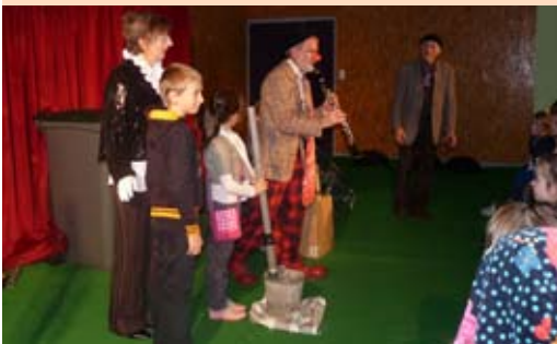
«Les clowns transforment les déchets en instruments de musique» par les Hilario's