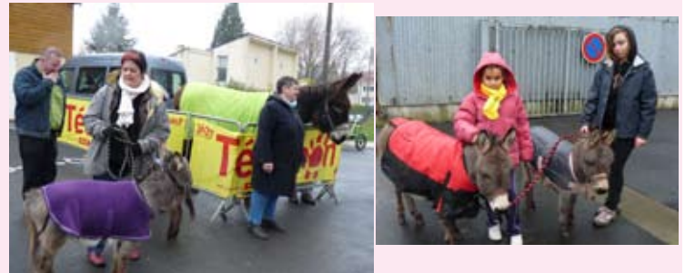
L'association «Les 3 Bourriques» avait prévu des tours en calèche