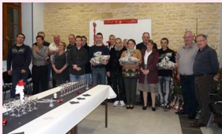
Le Maire et les membres du Conseil Municipal ont organisé une réception pour le Noël des employés communaux.