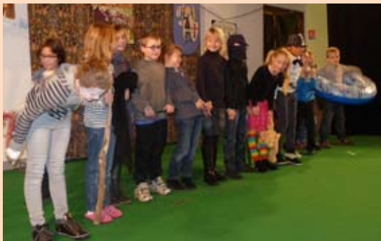
«A mots croisés» par l'école de Boulzicourt.