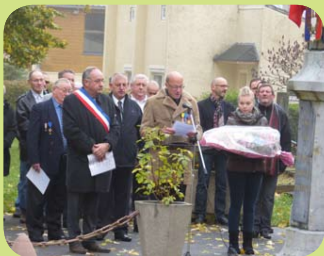
La traditionnelle cérémonie au monument aux morts