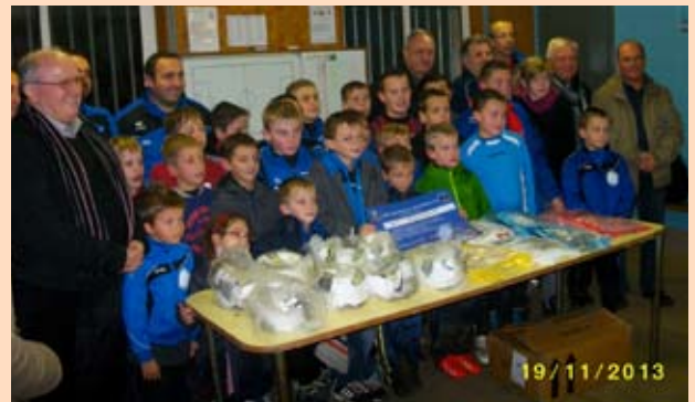
Comme chaque année, un tournoi de foot avec 7 adultes sera organisé le dernier dimanche de juin.

A rappeler: Tous les joueurs et dirigeants du foot sont présents chaque samedi pour les jeunes et tous les dimanches pour les seniors, de septembre à fin mai, (hors trêve de décembre à mars).