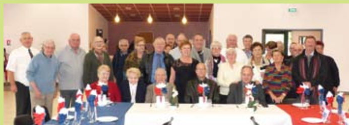
Cette journée s'est terminée par un repas convivial autour des nouveaux médaillés.