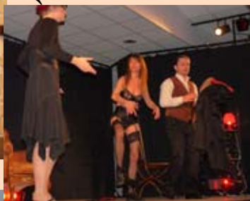
«La baby-Sitter» par les passeurs de jeu.