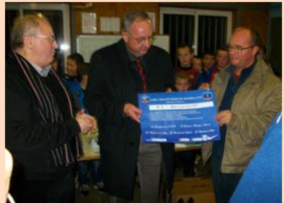
Ce 19 novembre, les membres du district des Ardennes ont décerné la remise du label qualité à notre école de football: gage de la qualité d'accueil des structures mises à leur disposition et des compétences des éducateurs diplômés.