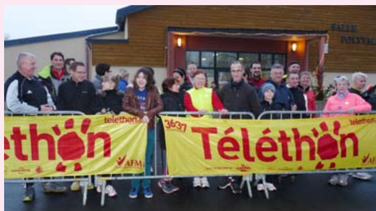
Comme la veille au soir, l'Athlétic Club a clôturé cette journée par une marche en début de soirée.

Saluons au passage cette toute nouvelle association de plus de 45 licenciés qui a gagné un challenge en organisant une course non stop de 24 h sur un parcours balisé de 1 km dans le village. A toute heure de la nuit, les participants se sont relayés sans relâche.