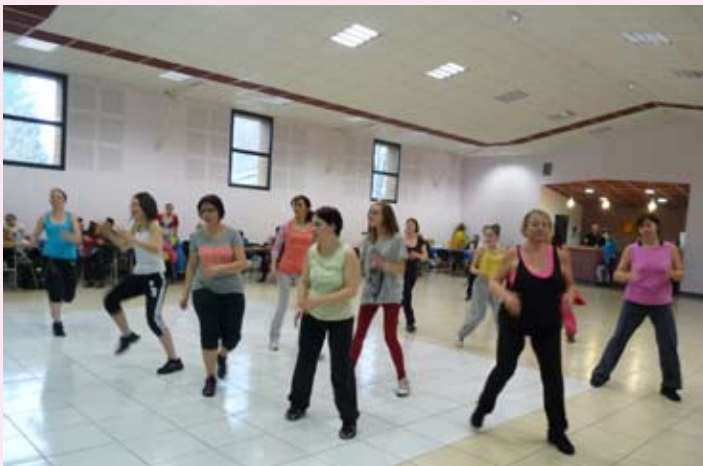
La Gym Entretien Adultes nous a offert une démonstration de Zumba.