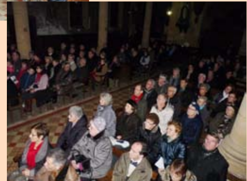
Le groupe vocal En'chan'té, invité par l'association «Loisirs, Art et Culture» de Boulzicourt, par leur talent et leur répertoire de Noël a conquis un grand public de plus de 120 personnes dans l'église