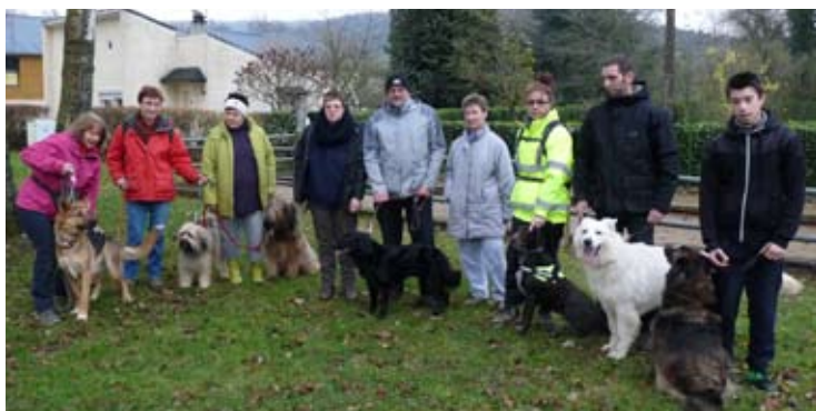
L'amicale Canine a participé à la randonnée vers Champigneul

Notons aussi la part active du KAPAP féminin self défense, du club JUJITSU et du club 3 ème âge de Boulzicourt dont nous regrettons l'absence de photos.