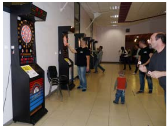
Le club de fléchettes «Les Vodsky de Boulzicourt», après avoir fonctionné toute la nuit a offert de nouveau toute sa recette au Téléthon