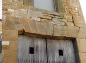
Le linteau à lui seul, nous montre la nécessité urgente de l'intervention