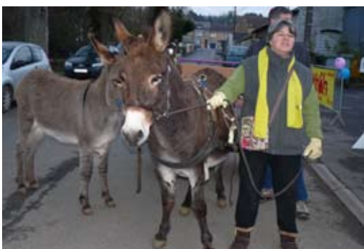
D'agréables guides se sont joints à notre démarche humanitaire

Notons aussi la part active du KAPAP féminin self défense, du club JUJITSU et du club 3 ème âge de Boulzicourt dont nous regrettons l'absence de photos.