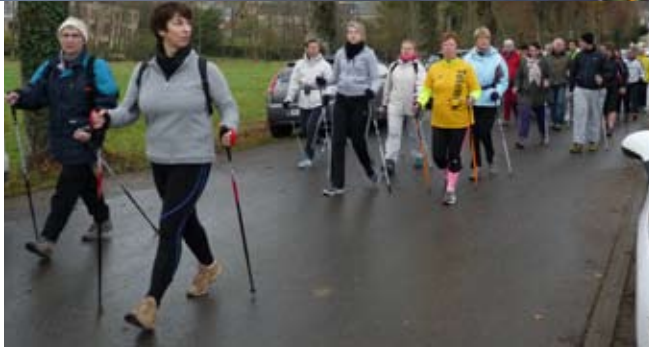
L'Athlétic club de Boulzicourt en marche, plus de 200 inscriptions de parcours.