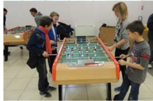
Le concours de baby foot organisé par l'école de football de Boulzicourt a connu un succès