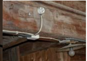
La protection électrique ne correspond plus aux exigences de sécurité actuelle