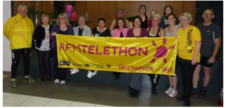
L'association «La Gym d'entretien adulte» avait organisé un cours de Zumba.