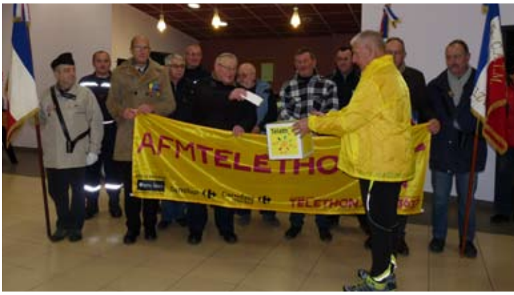
Don des anciens combattants (UNC) pour le Téléthon