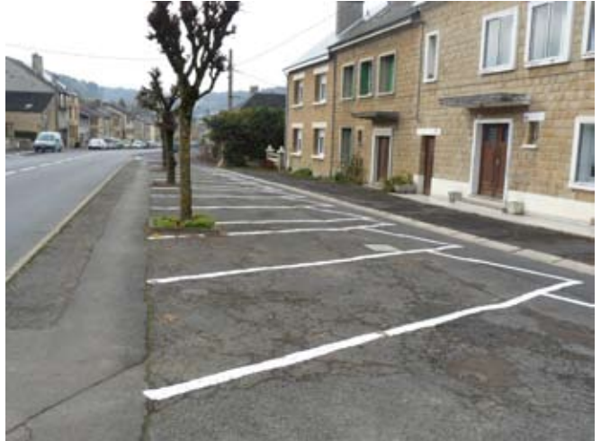
Pour rendre le village plus attrayant aux piétons et renforcer la sécurité, un traçage pour le stationnement des véhicules vient d'être réalisé en concertation avec les usagers.