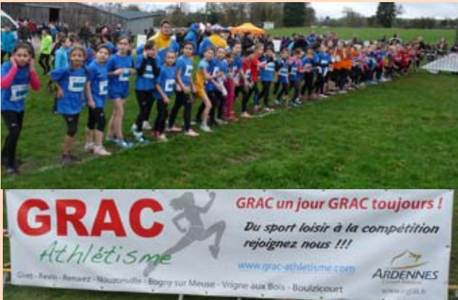
L'athlétique club de Boulzicourt membre du GRAC avait invité celui-ci à cette compétition