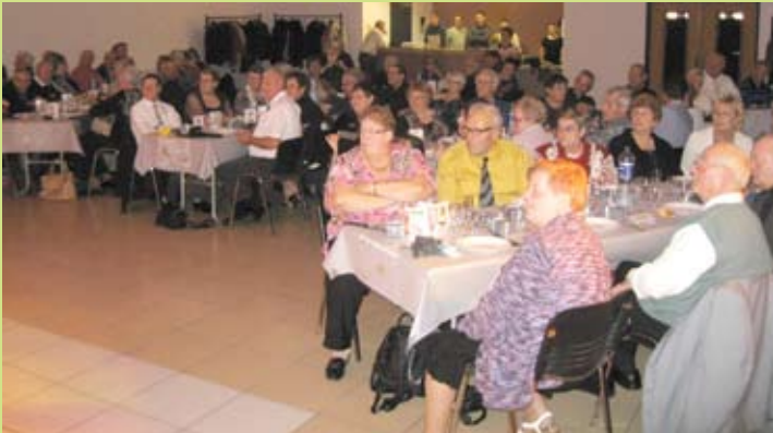
Tous les ans en fin d'année, le CCAS de Boulzicourt offre une agréable journée autour d'un repas cabaret pour ses seniors. Une centaine de convives ont apprécié fortement la troupe «Welcom Cabaret» de Donchery et l'orchestre «Vitaline»