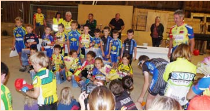
Le concours de cyclo-cross organisé par L'ECVB a encore agrandi son succès avec un changement de cadre plus champêtre autour des ateliers municipaux