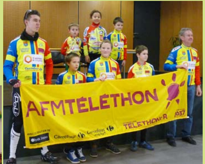
L'école de cyclisme est venue soutenir l'action humanitaire