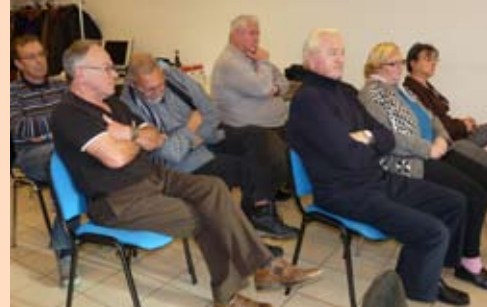
L'assemblée Générale de la pêche et du milieu aquatique