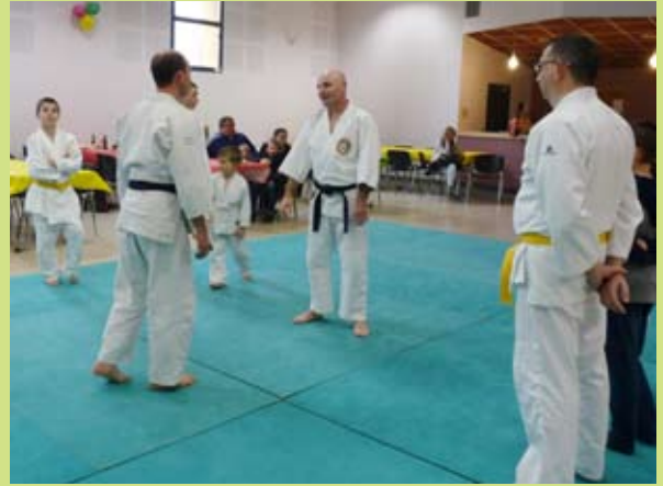
Le club de Jujitsu nous a donné une leçon d'initiation