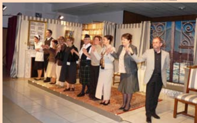
Le LAC présentait la troupe de théâtre «les 2 Masques» de Vouziers. La pièce «Devinez qui ?» a enthousiasmé les spectateurs.