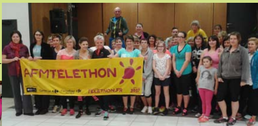
L'association «Gym d'entretien Adulte» après la démonstration du cours de Zumba