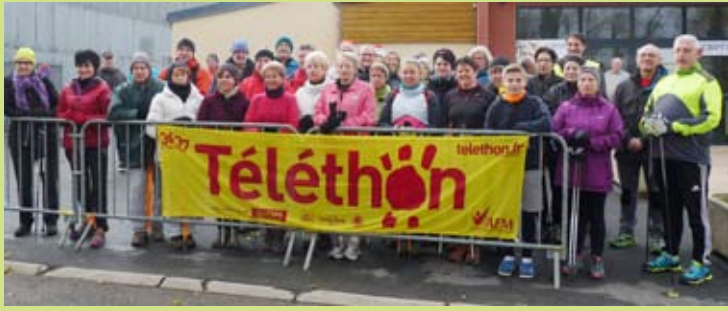
Après 24 h de courses, l'Athlétic club de Boulzi....court lançait le départ d'un parcours de 9 km avec près de 200 participants