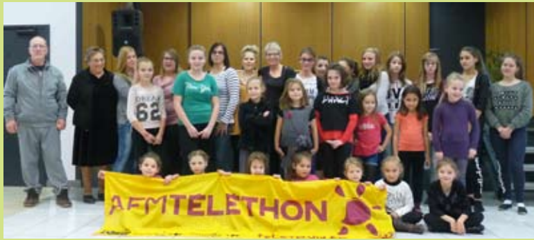
Le Twirling club bâton présentait un spectacle de danses