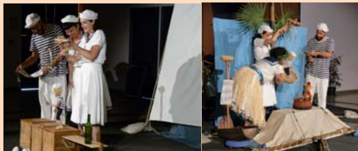
«J'ai le Marin» par Zipit Compagny