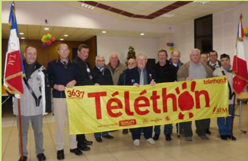
L'amicale locale de l'UNC a contribué largement à cette manifestation