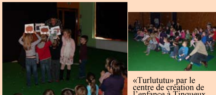
«Turlututu» par le centre de création de l'enfance à Tinquex