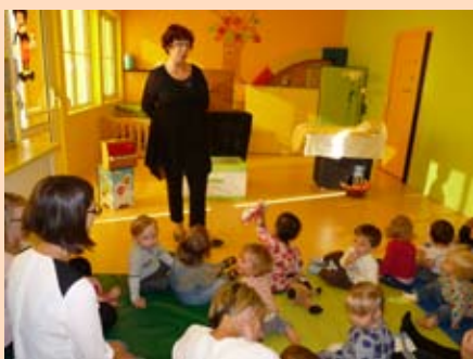
«Lili Riquiqui» par Marie-Cécile Liesch