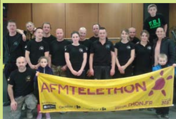
Le Krav Maga après leur séance d'initiation