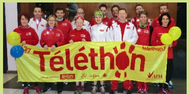
Les coureurs de l'espace Habitat 08