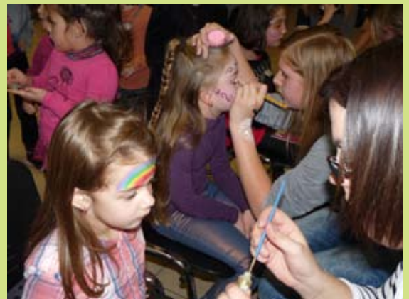
Une application de maquillage artistique par le Twirling club