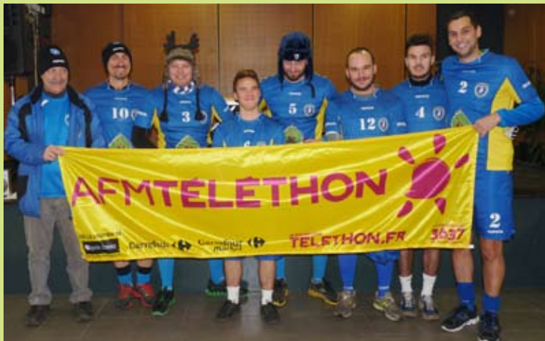
L'amicale sportive de Boulzicourt (Foot) était venue apporter son soutien