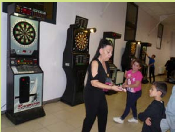
Les Vodsky avec leurs jeux de fléchettes électroniques