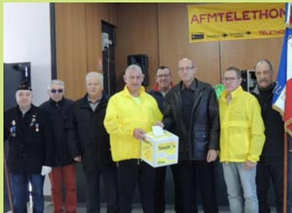
La sectio locale de l'UNC