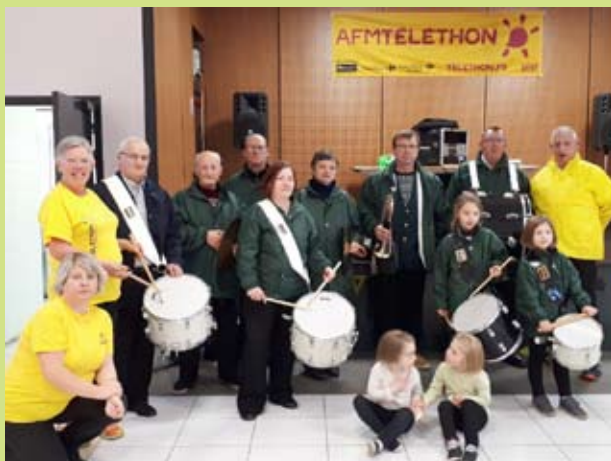
La fanfare de Boulzicourt