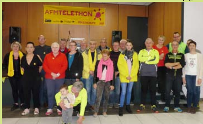
Une partie des organisateurs