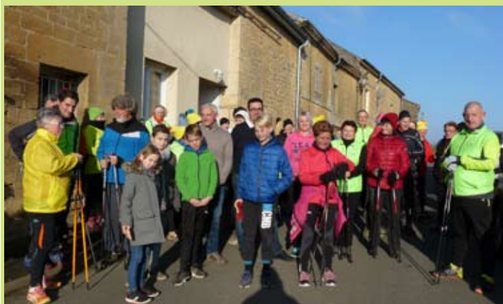
La pose des marcheurs à Champigneul