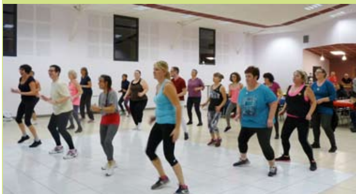
Le club GEA section Zumba