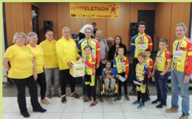
L'école cycliste de l'ECVB