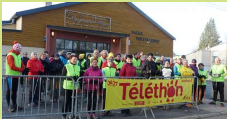
Le départ de la marche de 9 km organisée par l'Athlétic Club de Boulzicourt/Villers-Semeuse.