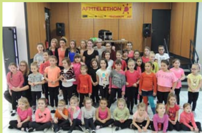
Le groupe «Twirling club»