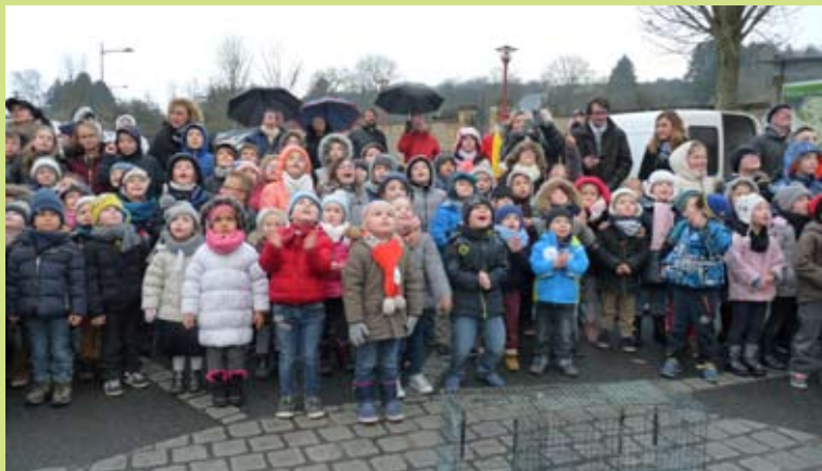
A la sortie de l'école, tous les yeux sont orientés vers le ciel