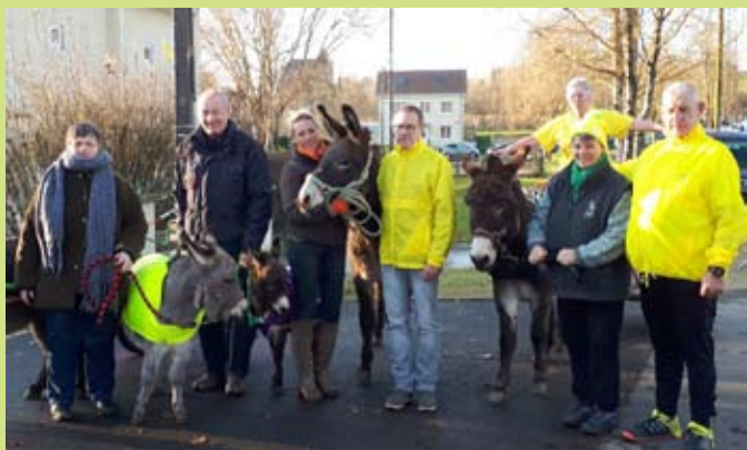
L'association «les 3 Bourriques»