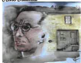
Né à Bouzicourt (ardennes)

Carte postale du Poète René DAUMAL né à Bouzicourt, dessinée pour à l'occasion d'une exposition organisée par le Frac à Reims.